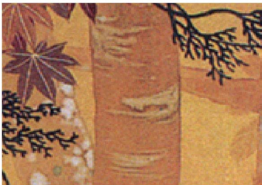
図7[下]. 「鶉鳴図」(明治34年). 左下: 「鶉鳴図」の一部. 右下: 岩上に描かれた垂込地衣絵.