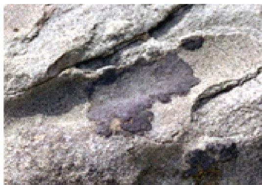
図8[上]. 銚子海岸で撮影した海岸岩上の地衣類。 左上：ホシスミイボゴケ。右上：キッコウアナイボゴケ。いずれも2002年4月、著者撮影。