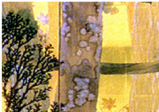
図6[上・中]. 「小倉山」(明治42年). 左上: 「小倉山」の一部. 右上: 右の樹幹に描かれた円形に近い垂込地衣絵. 中: 中央奥の樹幹に描かれた痾状地衣類を思わせる横に細長い垂込地衣絵.