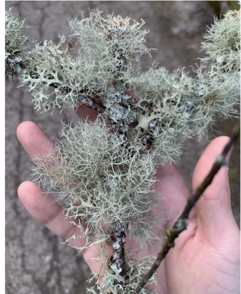
図1. 樹状地衣が山盛りの枝。

普段はワシントン大学の植物標本庫で標本観察などの室内作業をし、空き時間には地衣類を探しつつ、シアトル中心部から半径約10km内にある都市公園をいくつか散策しました。都市公園と言っても、人工的に造成したものだけでなく原生的な森林がほぼ手付かずで残っているようなものもありました。まず、多くの公園で樹状地衣を観察できたことに驚きました(図1)。日本の都市公園ではあまり見かけない光景です。さらに驚いたことに、複数の公園で Lobaria を観察することができました(図2)。 Lobaria の多くの種は原生的な森林に生育するため、健全な生態系の指標となると言われています。シアトルは地衣類にとっても住み