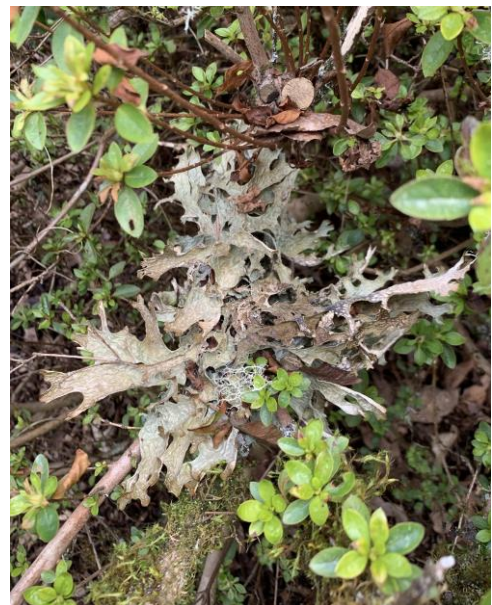
図2. 公園のツツジに L.pulmonaria が、不思議・・・。