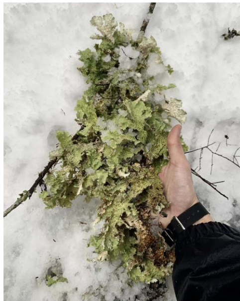
図5. 林床に落ちた北米固有種 Lobregana の塊。