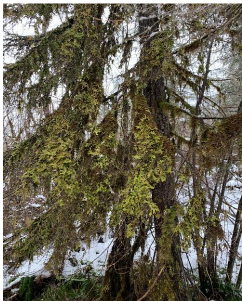
図4. 樹木全体を覆う Lobaria .

ては文献で読んでいたものの、樹高 60~70m のアメリカトガサワラが林立する原生林 (図 3) や、樹体全体が Lobaria に覆われた樹木を実際に目の当たりにして圧倒されました (図 4)。また、林床のそこら中に林冠から脱落した Lobaria 、「Stray Lobaria 」を見つけることができ (図 5)、生態学的研究が盛んであることにも納得しました。